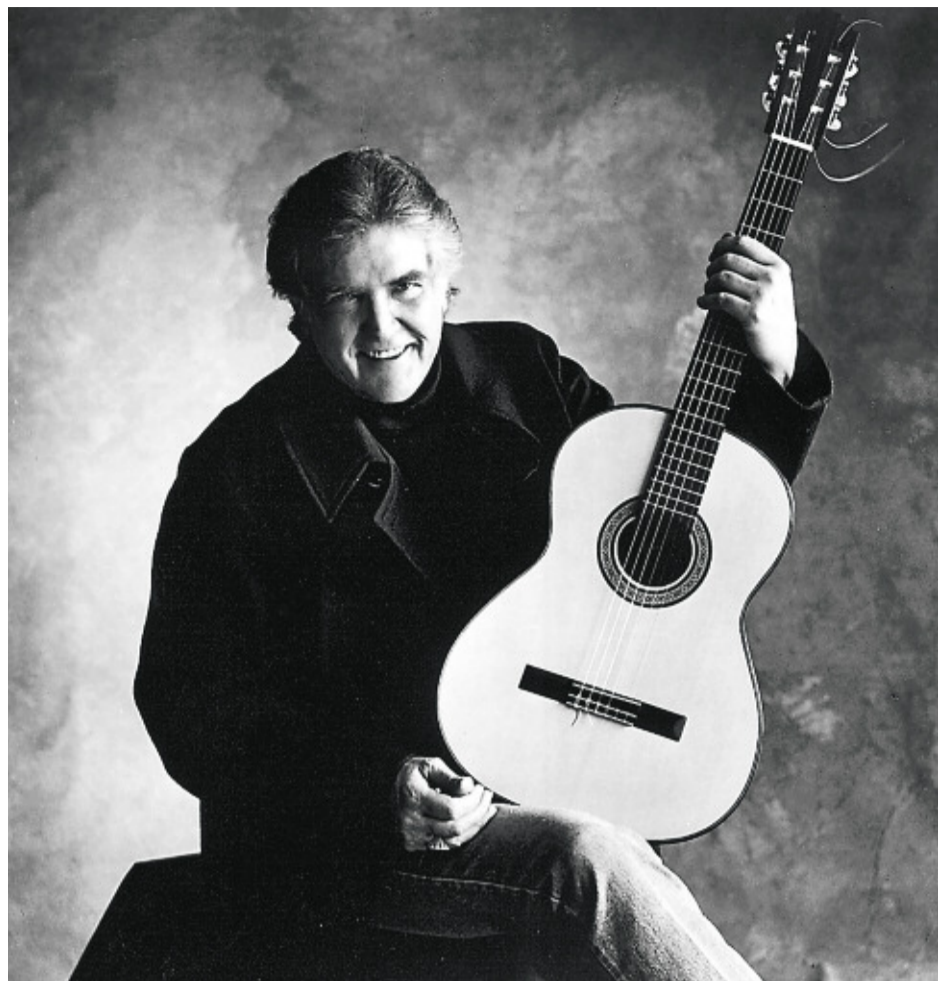
El cantautor tejano Guy Clark.

para matar, se convirtió en un símbolo de amor entre nosotros. Mis padres amaban la palabra hablada y escrita y, como aún no había televisión, después de cenar nos sentábamos en la cocina a leer poesía". Y el joven Guy siguió ahondando en ella: "Siempre me han interesado poetas que relatan cosas, como Robert Frost. Y creo que la música tejana se caracteriza porque todos nos hemos criado en la tra-